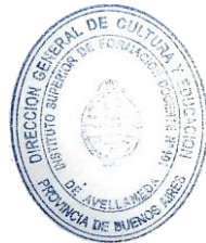
LUCIANO VERDIGLIONE DIRECTOR I.S.F.D. N° 101

NOTA: Es responsabilidad de cada aspirante, previo a la inscripción al concurso, tomar amplio conocimiento de la Resolución N° 5886/03 (Resolución Concurso de Cátedras) y Plan de Estudio de los Profesorados de Educación Física Resolución 2432/09