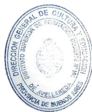
LUCIANO VERDIGLIONE DIRECTOR I.S.F.D. N° 101

NOTA: Es responsabilidad de cada aspirante, previo a la inscripción al concurso, tomar amplio conocimiento de la Resolución N° 5886/03 (Resolución Concurso de Cátedras) y Plan de Estudio de los Profesorados de Educación Física Resolución 2432/09